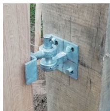
Platine carré avec le gond

B) Platine carré à pose avec les chevilles chemique pour les poteaux en parpaing.